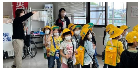
交流センター見学の様子

田尻交流センターや消防署などを訪れ、施設や働く人について調べました。普段目にするところまで見学し、子どもたちは興味津々でした。