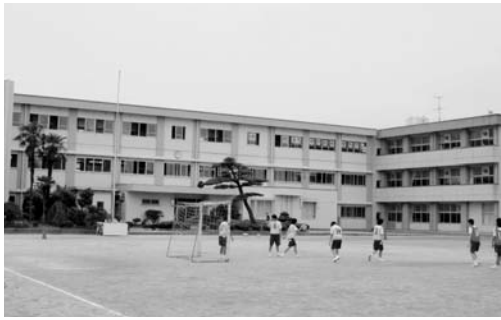
校舎の改築工事が行われる日高中学校