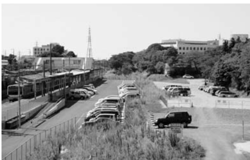
再整備が求められる大甕駅周辺

平成24年度を初年度に策定される日立市総合計画の中で、具体的な取組として位置付けるとともに、早期事業化に向けて、引き続き地域及び関係機関との協議・調整を進めていきたい。