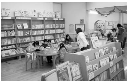
子ども図書室が設置されている多賀図書館

実施に当たっては、各図書館のサービス内容の違いなど事務処理上の課題を整理する必要があるため、県北4市の図書館長及び事務担当者による検討会で整理し、解決を図りたい。