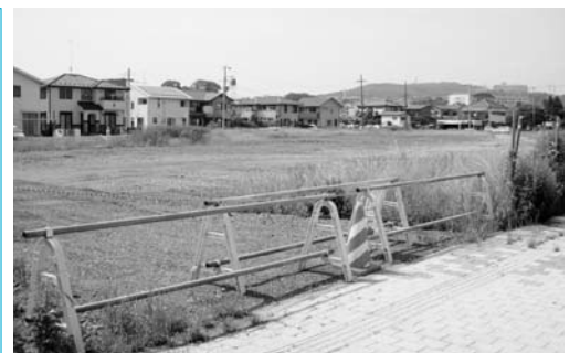
図書館が建設される旧日立電鉄線久慈浜駅跡地

特別福祉手当支給制度の今後の在り方については、不公平感の解消に配慮しつつ、様々な角度から検討していきたい。