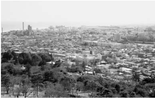
かみね公園から望む中心市街地

議員 本市の基本構想、基本計画の策定に当たり、目指すべき日立のまちの姿をどうイメージし、どのような戦略や都市経営のシステムで臨もうとしているのか伺いたい。