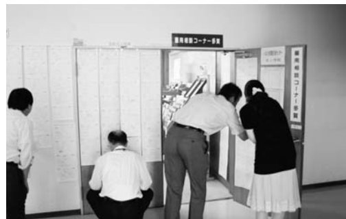
勤労青少年ホームにある雇用相談コーナー多賀

議員 緊急雇用対策としての市職員の採用について、昨年度の実績と今年度の募集状況について伺いたい。