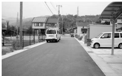
開発行為に伴い認定される市道（宮田町）