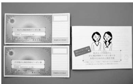
対象者へ配布された無料クーポン券と検診手帳