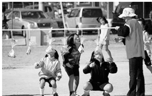
久慈地区で行われたスポーツフェスティバル

ティ組織に限られており、備品を活用する事業計画や地域が活性化するような体制づくりなどの条件を整理する必要がある。