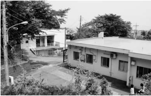
福祉施設が集まっている「ひかりの郷 鳩ヶ丘」(助川町)

これらの施設の老朽化の状況は十分承知しており、将来的な施設の在り方も含め、検討が必要な時期に来ていると認識している。障害者自立支援法の廃止の議論と、それに