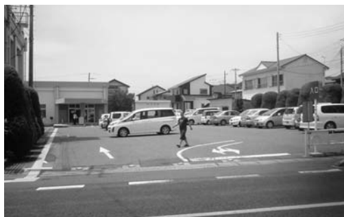
改修工事が行われる南部支所の駐車場

▼日立市職員の育児休業等に関する条例及び日立市職員の勤務時間、休暇等に関する条例の一部を改正する条例の制定《地方公務員の育児休業等に関する法律などの改正に伴い、職員の育児休業等に関する規定を国家公務員に準じて改める》 【要望】 ○育児休業制度を市職員に周知するとともに、本制度を