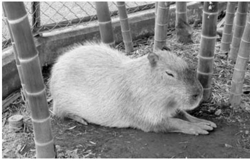
動物園の新しい仲間 カピバラのリク(オス1歳)

にリーダーを設定し、多くの児童に経験をさせようという考えであったと聞いている。しかし、自分たちで選んだリーダーを支え、協力するフォロワーシップを育成することも、立派な社会人になるために欠かすことの出来ない教育と考える。