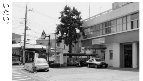
駅前への移設が求められている多賀町交番(末広町)