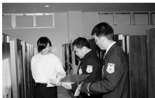
個室型店舗の立入検査を行う消防署員

議員 カラオケボックスなどの個室型店舗の安全対策が強化されるが、市内における該当する店舗の種類と数について伺いたい。