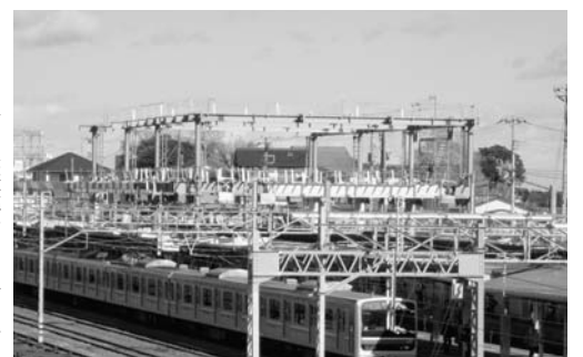
平成23年春の供用開始に向けて整備される日立駅橋上駅舎

▼平成21年度一般会計補正予算《1階の空きスペースに民間活力を利用したギャラリー付き店舗を整備する旧平和通り分庁舎整備事業費、建設から約50年経過している市役所本庁舎の耐震診断を実施する庁舎耐力度調査事業費、日立駅西口交通広場の部分改修の追加な