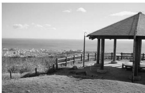
市街地が一望できる助川山の山頂

議員 日立市にはすばらしいハイキングコースがある。コース整備の考え方について伺いたい。