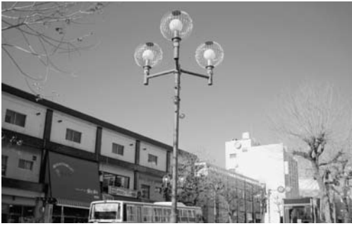
LEDが導入される多賀駅前中央商店街の街路灯

産業経済部長 国の総合経済対策である地域商店街活性化補助の対象として、ファイブマイタウンひたち協同組合