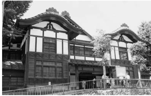
耐震補強などの工事が行われる日立武道館

▼平成21年度一般会計補正予算《国の補正予算執行停止に伴う子育て応援特別手当支給事業費の減額、0歳児の増加や保育単価の改定に伴う私立保育園運営委託費の増額など》 ▼平成21年度国民健康保険事業特別会計補正予算《後期高齢者支援助金及び介護納付金の概算納付額が確定したことに伴う整理など》