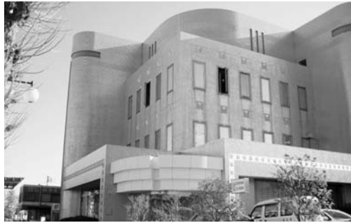
ギャラリー付き店舗が整備される旧平和通り分庁舎

生活環境部長 旧平和通り分庁舎の利活用について再検討を行い、1階は市が活用し、2階と3階は民間の賃貸方式を採用することとした。