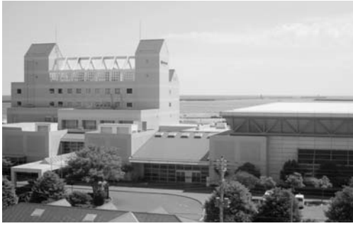
指定管理者が指定されたサンピア日立

▼久慈サンピア日立の指定管理者の指定 《平成22年4月21日から平成32年3月31日の期間、南洋ビルサービス株式会社・株式会社レンティック中部久慈サンピア日立管理運営共同企業体を指定する》