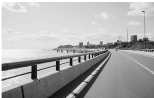
南伸が求められる国道6号日立バイパス (旭町)

市長 日立道路検討会において、市民参加により広く意見を聞きながらルートの見直し作業を進めており、現在、最終段階まできている。ルート案についても、J R