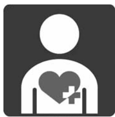
内部障害者であることを示すため「内部障害者・内臓疾患患者の暮らしについて考える特定非営利活動法人ハート・プラスの会」が全国的に普及活動を行っているハート・プラスマーク

議員 内部障害は、外見を見ただけでは分からない。内部障害者であることを示すカード型の証明書を交付してはどうか、見解を伺いたい。