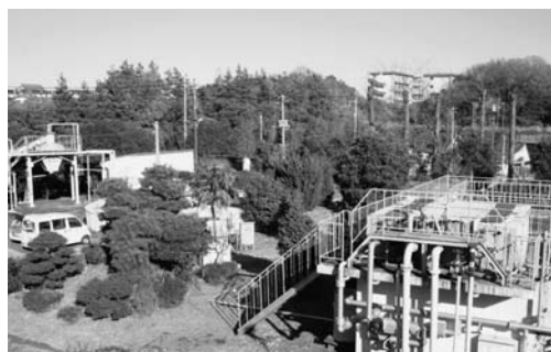
新たな利活用が求められる滑川処理場跡地

議員 滑川処理場の跡地一帯を、市民に親しまれる健康づくり公園として活用してはどうか、見解を伺いたい。