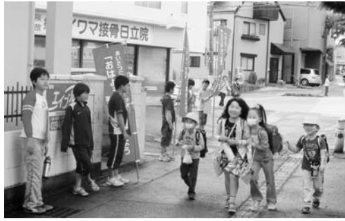
市内小中学校で行われているあいさつ運動

議員 道徳や情操教育などの徳育に力を入れるべきと考える。現在の推進状況と今後の取組について伺いたい。