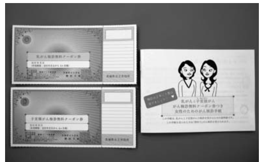
8月に配布された無料クーポン券と検診手帳

ら、女性のがん検診受診率の向上を図るため、検診の無料クーポン券の配布を実施している。8月下旬に、子宮頸がん検診対象者5、649人、乳がん検診対象者6、621人にクーポン券を郵送した。