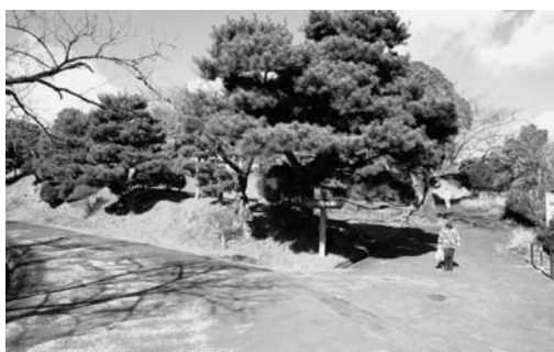
かみね公園内の各施設を結ぶ園路

問題解決の一つの方法として、公園内の施設や駐車場を結ぶ周回バスを運行している。地形的特徴を考えると、移動の円滑化は取り組まなければならない課題である。そのため現在の周回バスのP R