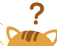
■「男は仕事、女は家庭」という考えかたに賛成する人の割合