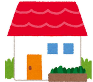
一戸建て・一軒家