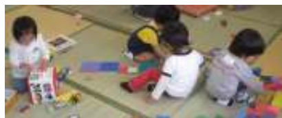
お子さんにはおもちゃの用意があります