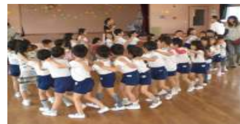
じゃんけんゲームで大きな輪になりました(水木)