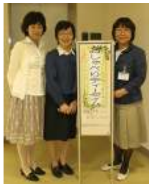
私たちが家庭教育サポーターです

井戸端会議の良いところは、 いろいろな人のいろいろな子育てを知って、 自分の子育てを振り返ることができることです。