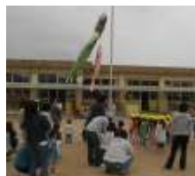
泳ぐ鯉のほいを見上げました(田尻)

未就園児とおかあさんが集まる“あそびのつどい”に参加し、 おかあさん方のお話を聞いています。