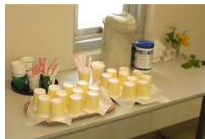
おいしいコーヒーを用意します

井戸端会議の良いところは、 いろいろな人のいろいろな子育てを知って、 自分の子育てを振り返ることができることです。