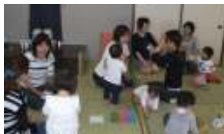
おしゃべりの輪ができます

毎回、4・5人のおかあさんのグループにサポーター1人が加わり、 子育てについておしゃべりをしています。