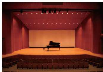
多目的ホール(通称:Jホール)

◆十王総合健康福祉センター(通称:ゆうゆう十王)は、市民の健康づくりの場および市民の福祉・文化活動の場として親しまれている総合施設です。多目的ホール・研修室・調理実習室などの貸出し(有料)も行っています。ご利用の際は事前の申請が必要です。詳細はお問い合わせください。(☎39-7111)