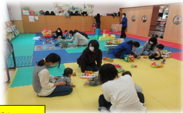
もこちゃん広場での一コマ

「みんなでたのしく子育てを！」を合い言葉に、前期0～3歳児対象の子育て広場の短期講座がいよいよ開講しました。 たくさんのご応募ありがとうございました。9月までの活動期間、親子の触れ合いや季節に合ったイベントを計画しています。参加者同士の交流を深めながら、日頃忙しく子育てしている保護者のリフレッシュや癒しの時間になれるといいです。楽しく活動していきましょう！