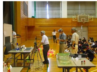
【1年・2年・3年理科クラブ授業】