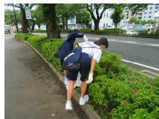
【1年生校外ボランティア】

コロナ禍において保護者・地域の皆様方及び関係の皆様方には何かとご心配をおかけしているところですが、引き続き本校教育活動への温かな御支援・御協力のほどをお願い申し上げます。