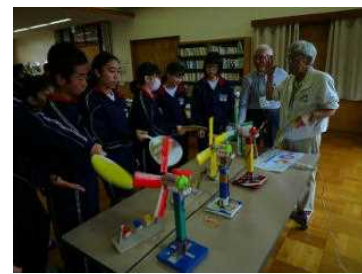
日立理科クラブの授業

梅雨空に紫陽花が満開の頃を迎えました。子ども達は、6月8日から通常登校になり普段の生活が戻りつつあります。換気や消毒に気をつけながら元気に過ごしています。現在、学校では4月5月に休校で出来なかった分の学習について漏れのないよう授業を行っています。また、今後は授業時数の確保のため、夏休みを8月6日から16日までの11日間と短縮し、更に1学期を9月4日までに延長して授業日を増やして対応します。