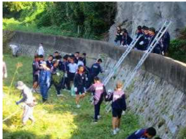
全校ボランティア活動