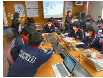
地域講師プログラミング授業