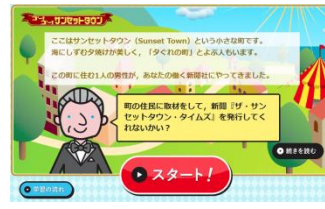
▲家庭での学習履歴が残ります