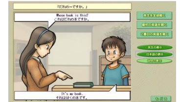
▲英文ごとに繰り返し聞けます