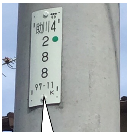
東電柱 番号 助川 4-288