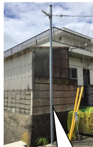
専用柱 (鋼管ポール)