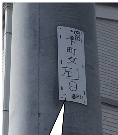
NTT 柱 番号 下町支左 1/9

東電柱や NTT 柱以外に、専用柱（鋼管ポール）に器具を取り付けている場合もあります。