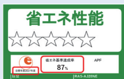
統一省エネラベルの例