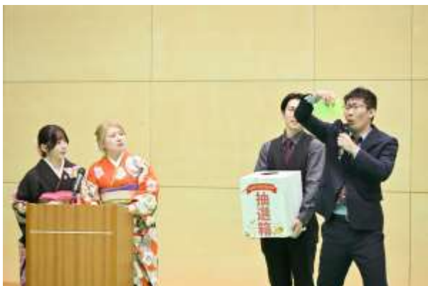
アトラクション（抽選会）の様子