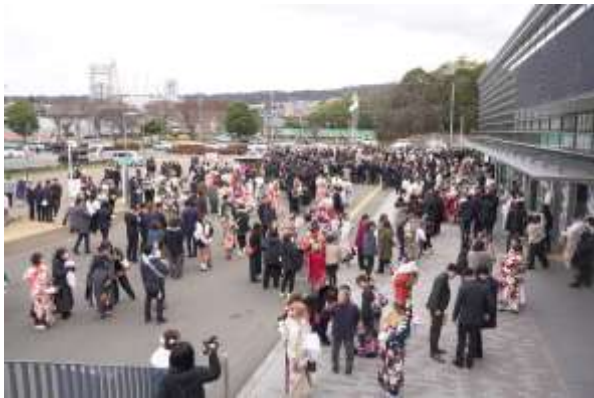
アリーナ前 式典前の様子