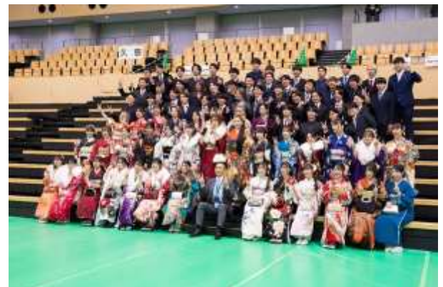
出身中学校ごとの記念撮影