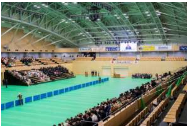
市長のビデオメッセージ