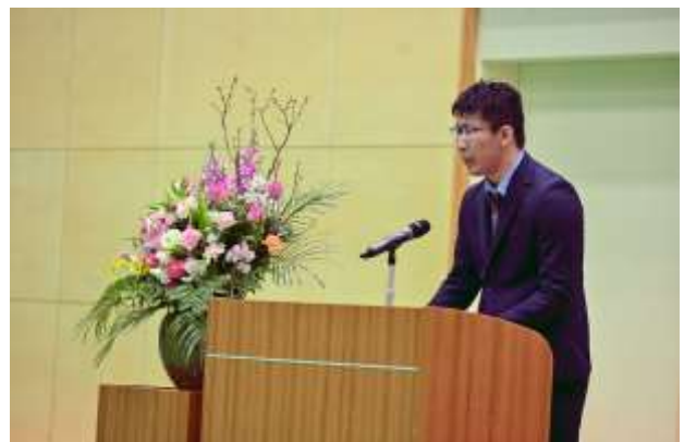
実行委員長の挨拶