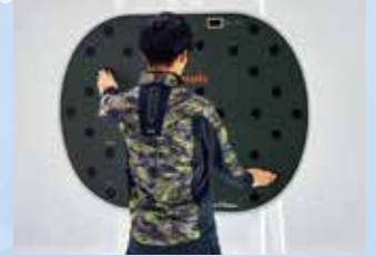
スープリュームビジョン