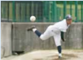
スピードガンコンテスト