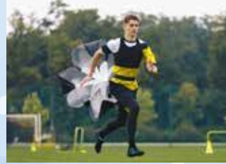
パラシュートダッシュ