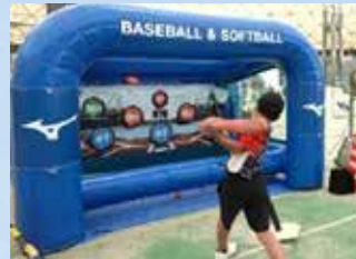
ヒッティングターゲット