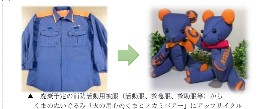
▲ 廃棄予定の消防活動用被服（活動服、救急服、救助服等）からくまのぬいぐるみ「火の用心のくまヒノカミベアー」にアップサイクル

障がい者施設と連携し、廃棄予定の活動服、救急服及び救助服を素材として、「火の用心のくまヒノカミベアー」の製作販売を行い、防火啓発及び施設利用者の工賃向上に寄与する取組を継続しています。