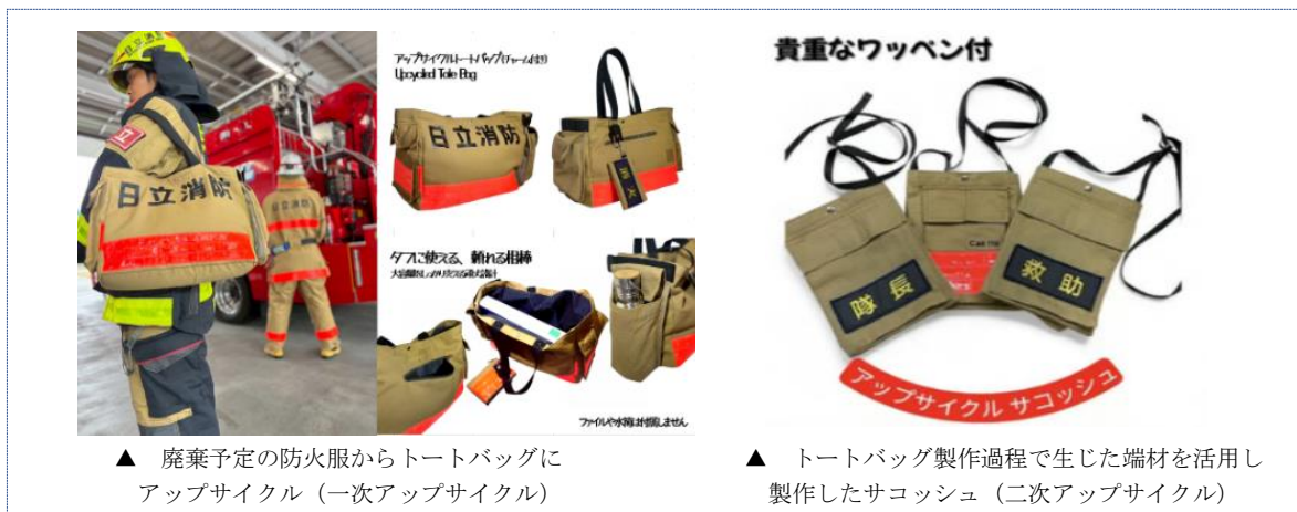
▲ 廃棄予定の防火服からトートバッグにアップサイクル（一次アップサイクル）