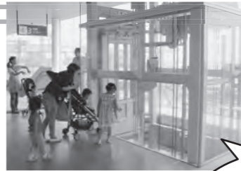
ホームと行き来するためのエレベーター

また、ホームまでの距離は変わりませんが、その間に50mの「動く歩道」が設置されました。