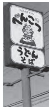
大久保店 国道六号沿

IBARAKI キッズクラブ協賛店舗検索 http://www.kids.pref.ibaraki.jp/kids/pcstyle/search.html