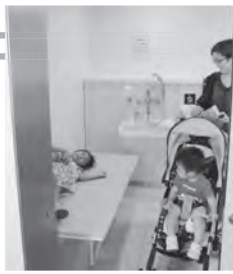
多目的に使えるベッドのあるトイレ