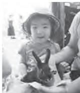
ウサギやモルモットを抱っこできます。運がよければ隣のわんぱく広場でニシキヘビともふれあえるよ！

また、園内には次々と赤ちゃんが生まれています。ライオン以外に、シカやチンパンジーの赤ちゃんも実は自然繁殖が基本なのでこれからたくさん子どもたちが見られるかもしれないですね。