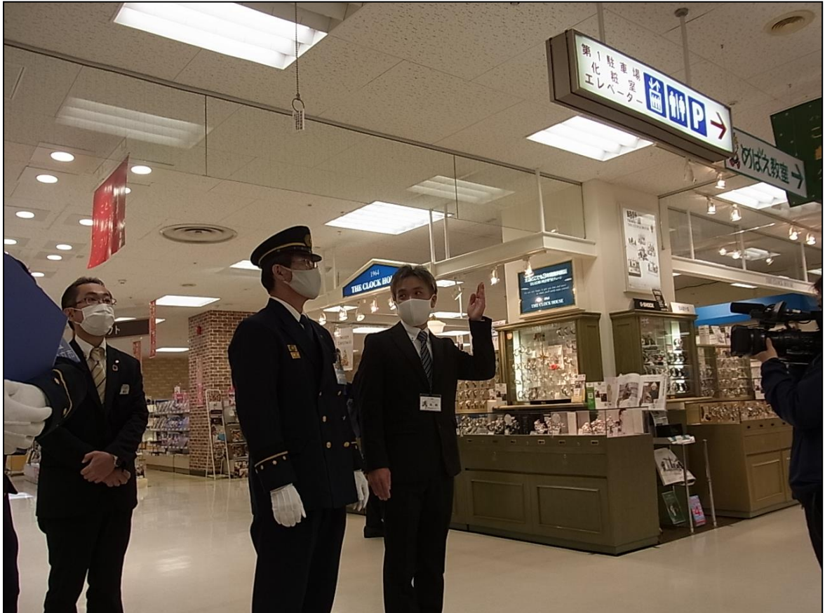
大型店舗年末特別査察