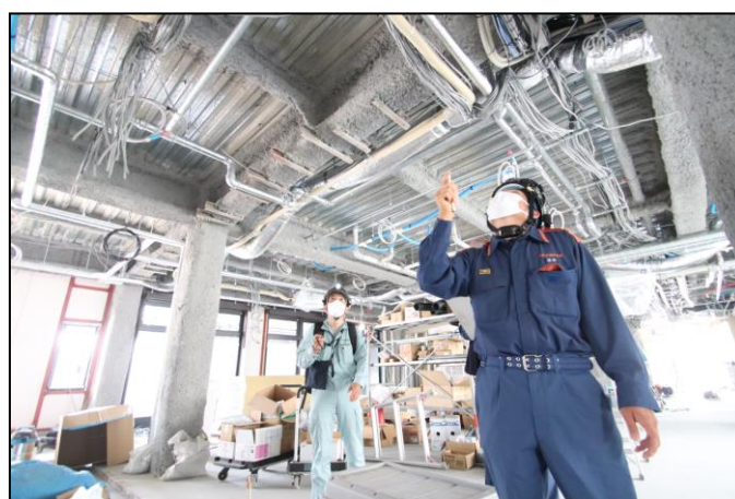
消防用設備施工状況の確認