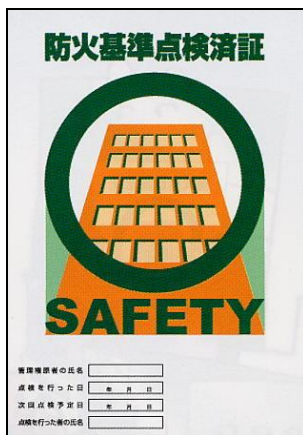
防火基準点検済証（図1）