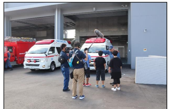
行政放送撮影風景