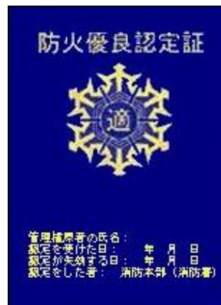
防火優良認定証（図2）