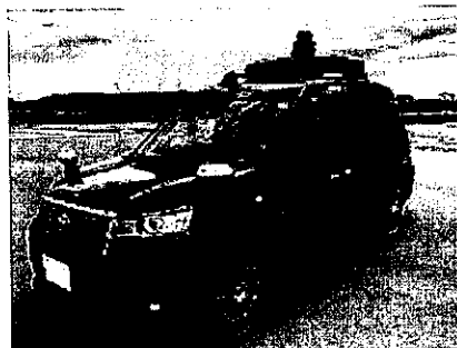
※自動運転タクシー（イメージ写真）