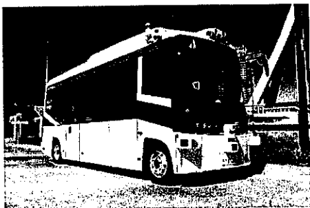
※自動運転バス（イメージ写真）