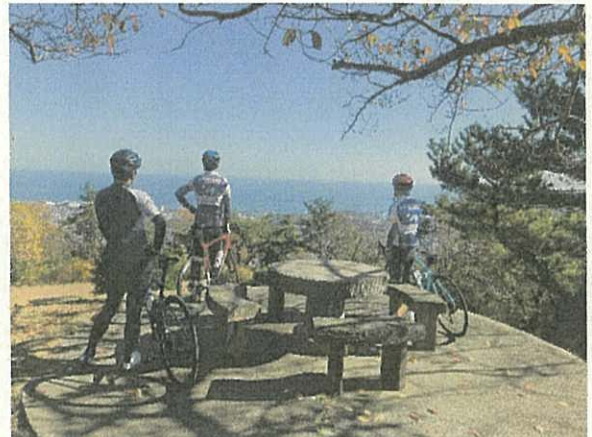
令和4年11月開催「ライドアラウンド in 日立 1DAY」の様子