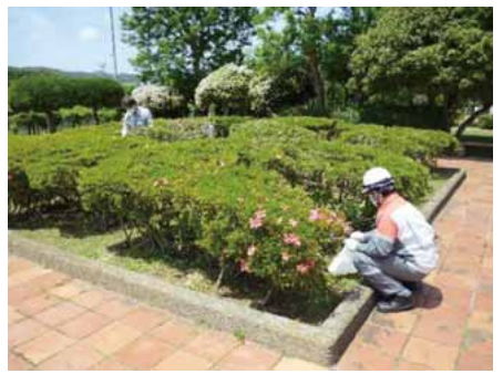
池の川処理場屋上公園