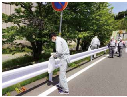
池の川処理場周辺

日上市では、ごみゼロの日(5月30日)を含む5月28日から6月3日までの7日間を「ひたち・ごみゼロウィーク」としており、市内各所でごみ拾いなどの環境美化活動を実施しました。 企業局でも、浄水場や下水処理場など、上下水道施設の周辺や屋上公園のごみ拾いを行いました。 6月以降も、毎月ごみ拾いを実施し、施設周辺の環境美化に努めています。