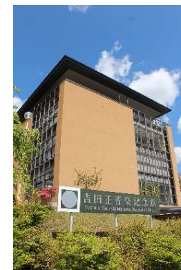
懐かしの曲に出会える場所