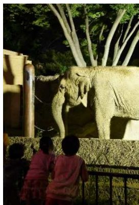
普段の姿と違う夜の動物園