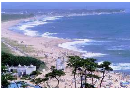
33kmの海岸線にある伊師浜海水浴場