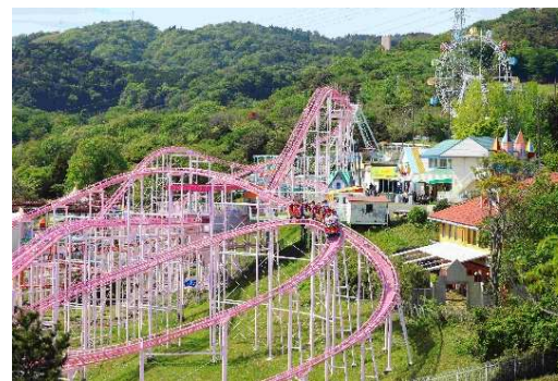
地形をいかしたスリル満点のジェットコースター