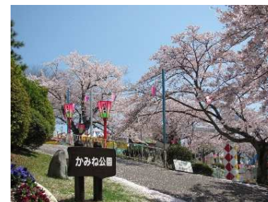
日立市民の憩いの場