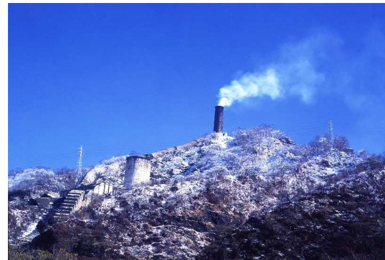
ものづくりのまちの原点である大煙突（当時世界一の高さ）