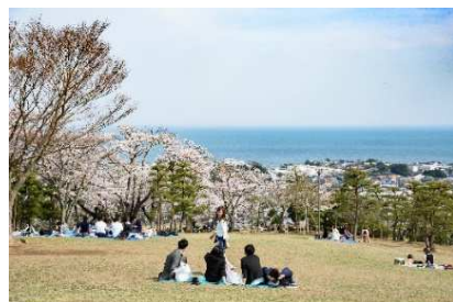
安らぎとくつろぎを感じる芝生広場