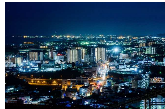
日本夜景遺産に認定されたかみね公園からの夜景