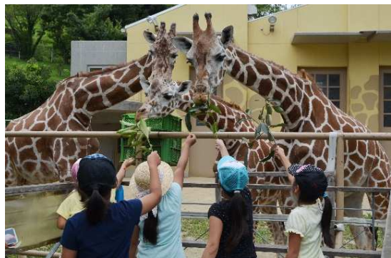
遊びながら学べる動物園