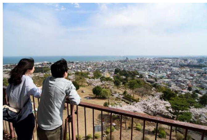
素晴らしい景色と爽やかな風を感じられるデートスポット