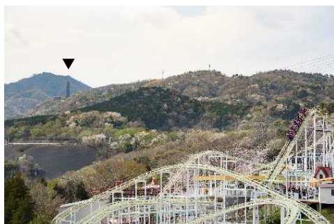
シンボルである大煙突が見守る