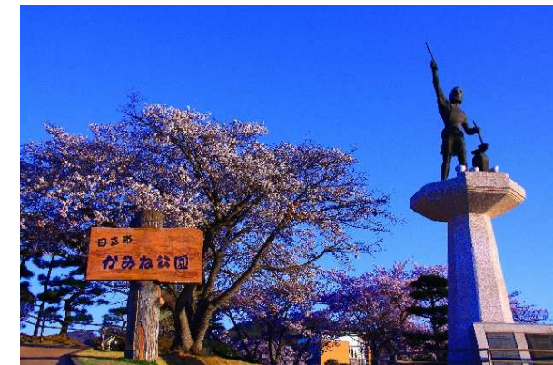
姉妹都市の方角を指さすバルカン像