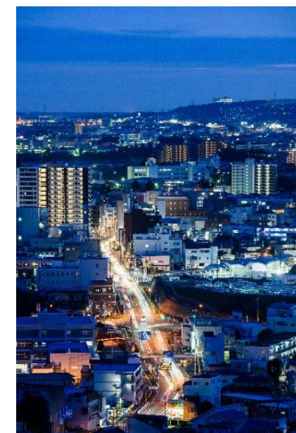
絶景夜景の穴場スポット