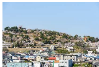
桜色に染まった丘の上の公園