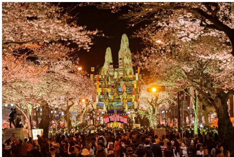
かみね公園とともに日本のさくら名所100選に選ばれた平和通り