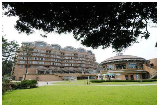
33年連続宿泊利用率No1の国民宿舎鶴の岬