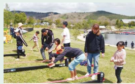
パノラマ公園＝一部有料