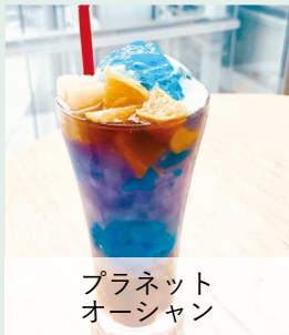
プラネット オーシャン