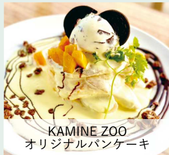
KAMINE ZOO オリジナルパンケーキ