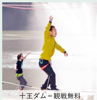
十王ダム＝観戦無料