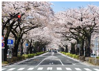
地域資源を活用した 商業・観光推進事業