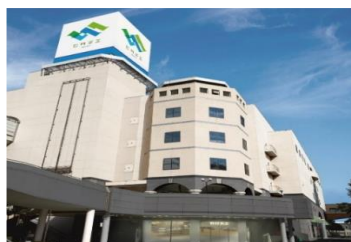
中心市街地等の活性化事業