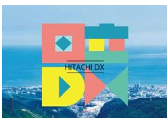
デジタル・グリーンランス フォーメーション推進事業