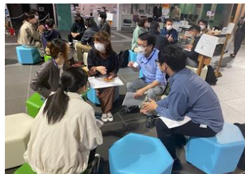
若者チャレンジ応援事業