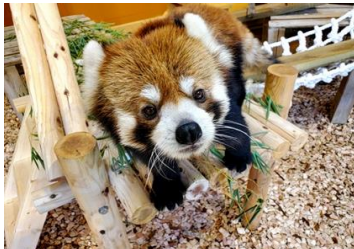
まちの魅力向上による 交流人口拡大事業