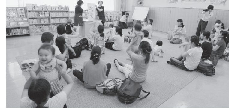
「子どもとゆっくりできる場所にあってうれしい！」という利用者ママさんの声も！

多賀図書館では、幼児向けの絵本や紙芝居が置いてある広々としたスペースに設置されています。育児本などは大人のコーナーへ行かなければいけなかったのが、子どもと同じ場所ですべて探しができるので小さい子連れでも安心ですね。館長のお話では、ママさんたちだけでなく、お孫さんをつれて利用するおじいさん、おばあさんや、土日に子どもを連れてくるイクメンの姿も見られるそう。