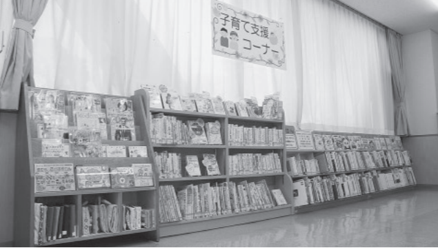
コーナーの棚に吹き出しが置いていてかわいいし、さかしやすい！