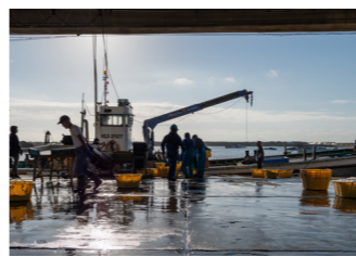
会瀬漁港の水揚げの様子

水揚げされた新鮮な魚は、仲買業者等により水戸市公設地方卸売市場や豊洲市場等に出荷されるほか、市内の地魚を取り扱う小売店や