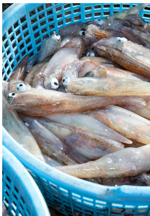
底びき網漁で水揚げされたヤリイカ