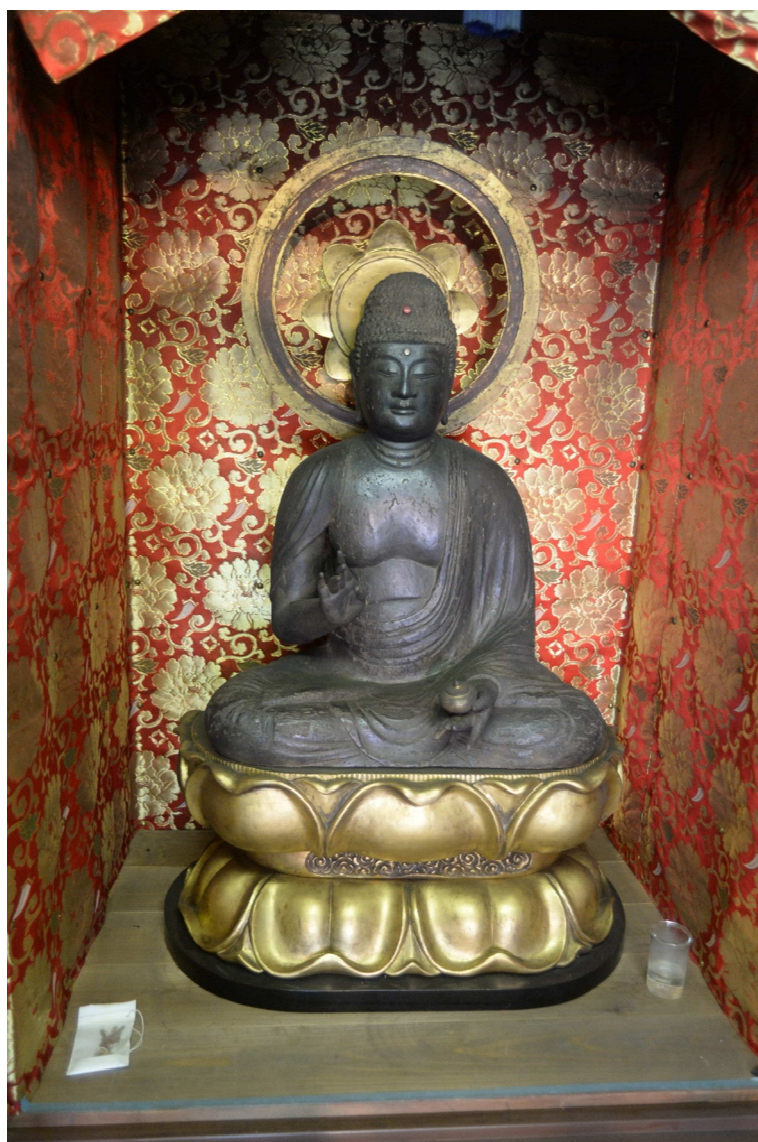
県指定彫刻「木造薬師如来坐像」(昭和 54 年 11 月 1 日指定)