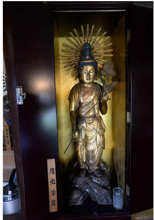
市指定彫刻「月光菩薩立像」 (昭和 49 年 3 月 27 日指定)