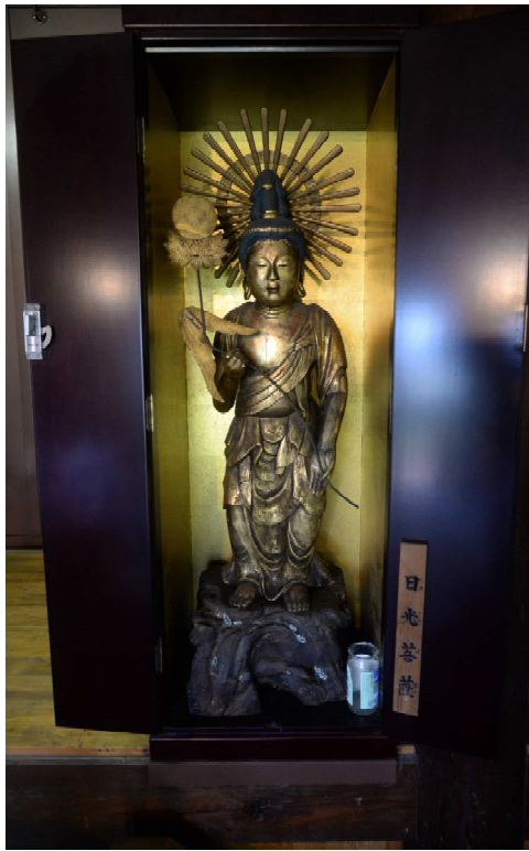
市指定彫刻「日光菩薩立像」 (昭和 49 年 3 月 27 日指定)