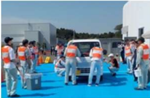
車両確認検査（実習）

2025年9月2日、3日の2日間、原子力災害時の避難支援に備えた「避難退域時検査研修」を実施し、原電グループから49名が参加しました。