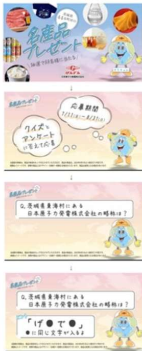
< You tube 広告 >