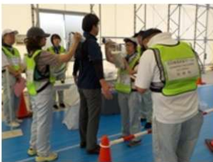
住民確認検査（実習）