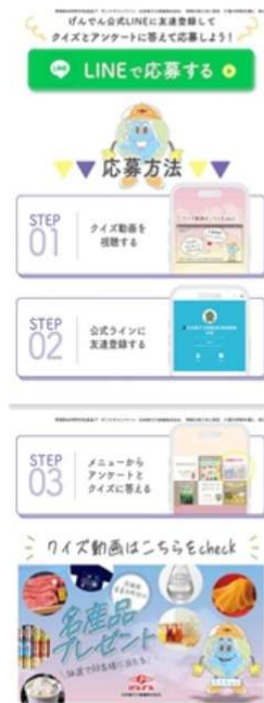
< Instagramによる紹介 >

東海第二発電所をより身近に感じていただけるよう、2025年7月から8月にかけて、茨城県内全域を対象にYouTube広告を配信しました。