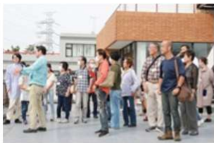
テラパーク屋上から 安全性向上対策工事を見学