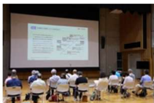
状況説明会（東海村）

本説明会は、6市村（東海村、日立市、ひたちなか市、那珂市、常陸太田市、水戸市）は来年度も、またUPZ自治体（鉾田市、笠間市、大子町、高萩市、常陸大宮市、城里町、大洗町）は今年度と来年度に分けて実施いたします。