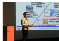
地域共生部長によるプレゼン