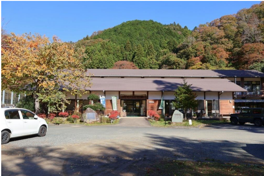
たかはら自然塾外観

茨城県日立市十王町の山間に、平成 19 年 3 月に廃校となった高原小学校を「地域の自然環境を活用し、様々な体験ができる」体験型の施設にリニューアルした『たかはら自然塾』があります。