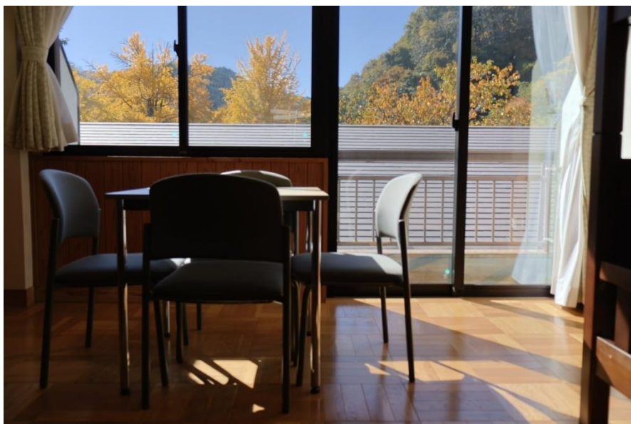
4 人掛けのテーブルでトランプも楽しいね