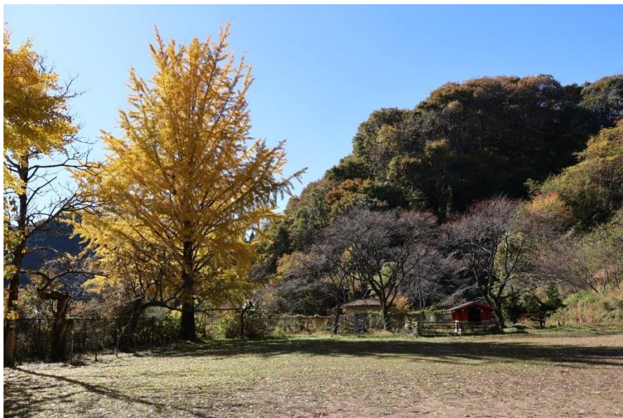
すべり台やブランコもあります

たかはら自然塾は、立地を活かした大自然の中での季節の体験や、体育館を活用した練習合宿や研修、子ども会や少年団の BBQ 会場などとして様々な方が利用しています。