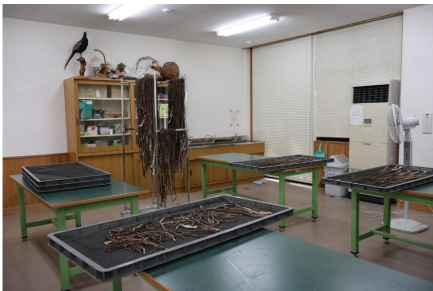
里芋のつるの皮を干しています