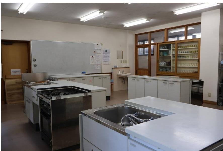
郷土料理体験教室