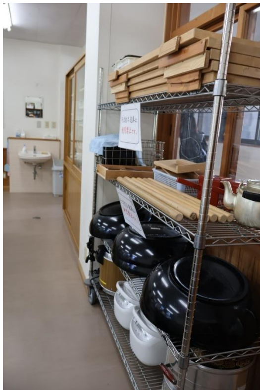
そば打ち用の道具などがあります

郷土料理体験教室では主に、そば打ちやうどん打ちなどが行われています。季節によってはもちつき体験や季節の食材をつかったピザ作りなども。