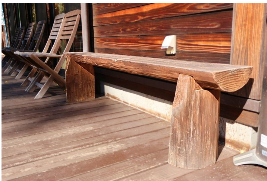
人気のベンチづくり

体験の種類はとても豊富です。子ども会や少年団などのイベントに利用したり、みんなで体験も良い思い出作りになります。もし「こんなのやってみたい」という内容がありましたら、検討することも可能とのこと。ぜひ利用してみてはいかがでしょうか。