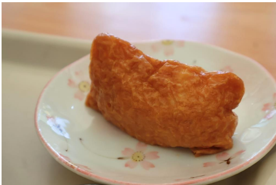
このいなり寿司がとっても美味しいです

そばの他に、いなり寿司とお新香もついているのでボリュームもあり大満足です。お値段もお手頃なのでぜひ一度食べに来てみてはいかがでしょうか。