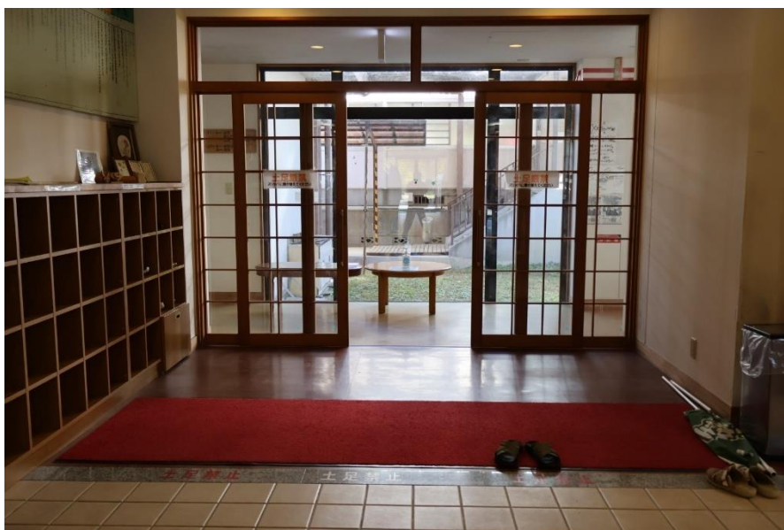
体験・宿泊棟入口

体験・宿泊棟では、主にそば打ちなどの体験を行う教室と、宿泊用のお部屋となります。