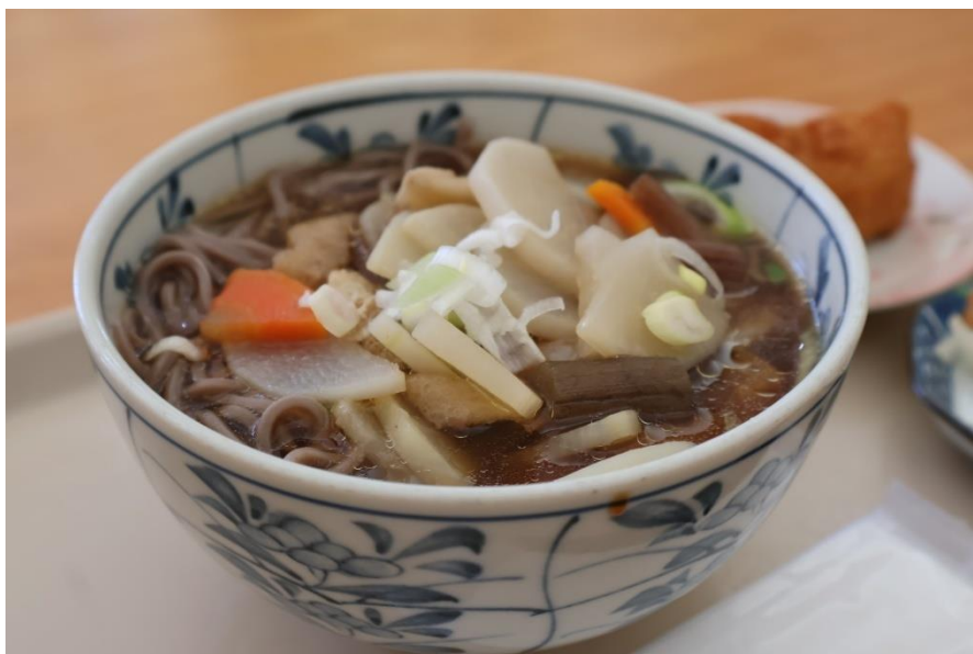
今が旬！郷土料理のけんちんそば

食堂は、ランチタイム（11時～14時）は一般の方も利用ができます。食材はたかはら自然塾で作ったお米やそば、地元産の野菜を使ったメニューを提供しています。