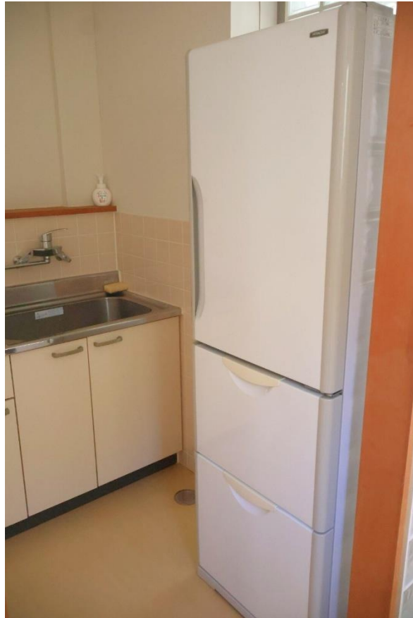
冷蔵庫もあります

共有スペースには冷蔵庫や洗濯機、トイレなどもあります。共有なので、名前など記載するのが良さそうです。