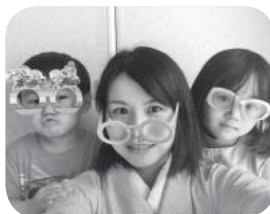
ユキママ 5歳♀ 2歳♂ 4人家族

子どもが産まれてから本格的に水彩画を開始。にがおえ講師・子ども絵画と造形講師やフリマ出店をしています。地元でママ達を盛り上げるためのイベントも開催。日立市では子連れで海岸清掃や着付け教室、託児ヨガに参加。ご近所さん達と友人になり助け合っています。大変な子育てを頑張っている全てのお母さんを尊敬し、役に立ちたいので、日立市の子育て情報編集委員に応募しました。よろしくお願ひします！