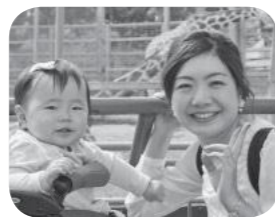
ユリママ 1歳♀ 3人家族

子どもが産まれてから本格的に水彩画を開始。にがおえ講師・子ども絵画と造形講師やフリマ出店をしています。地元でママ達を盛り上げるためのイベントも開催。日立市では子連れで海岸清掃や着付け教室、託児ヨガに参加。ご近所さん達と友人になり助け合っています。大変な子育てを頑張っている全てのお母さんを尊敬し、役に立ちたいので、日立市の子育て情報編集委員に応募しました。よろしくお願ひします！