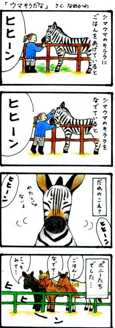
もちろんこのあひポニーたちもごはんをおいしくいただきましたよ！