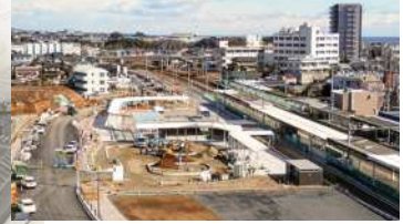
西口駅前広場(工事の状況)