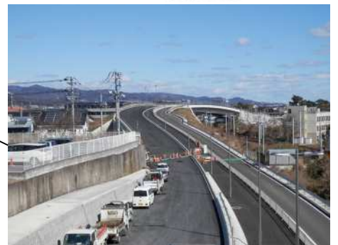
大甕水木連絡道路（工事の状況）