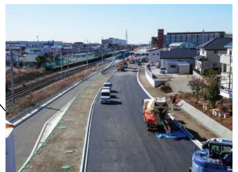
南北アクセス道路（工事の状況）