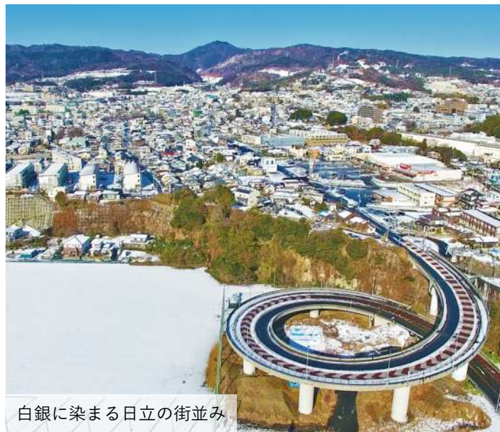
白銀に染まる日達の街並み