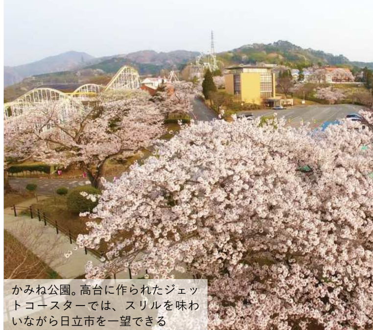
かみね公園。高台に作られたジェットコースターでは、スリルを味わいながら日立市を一望できる