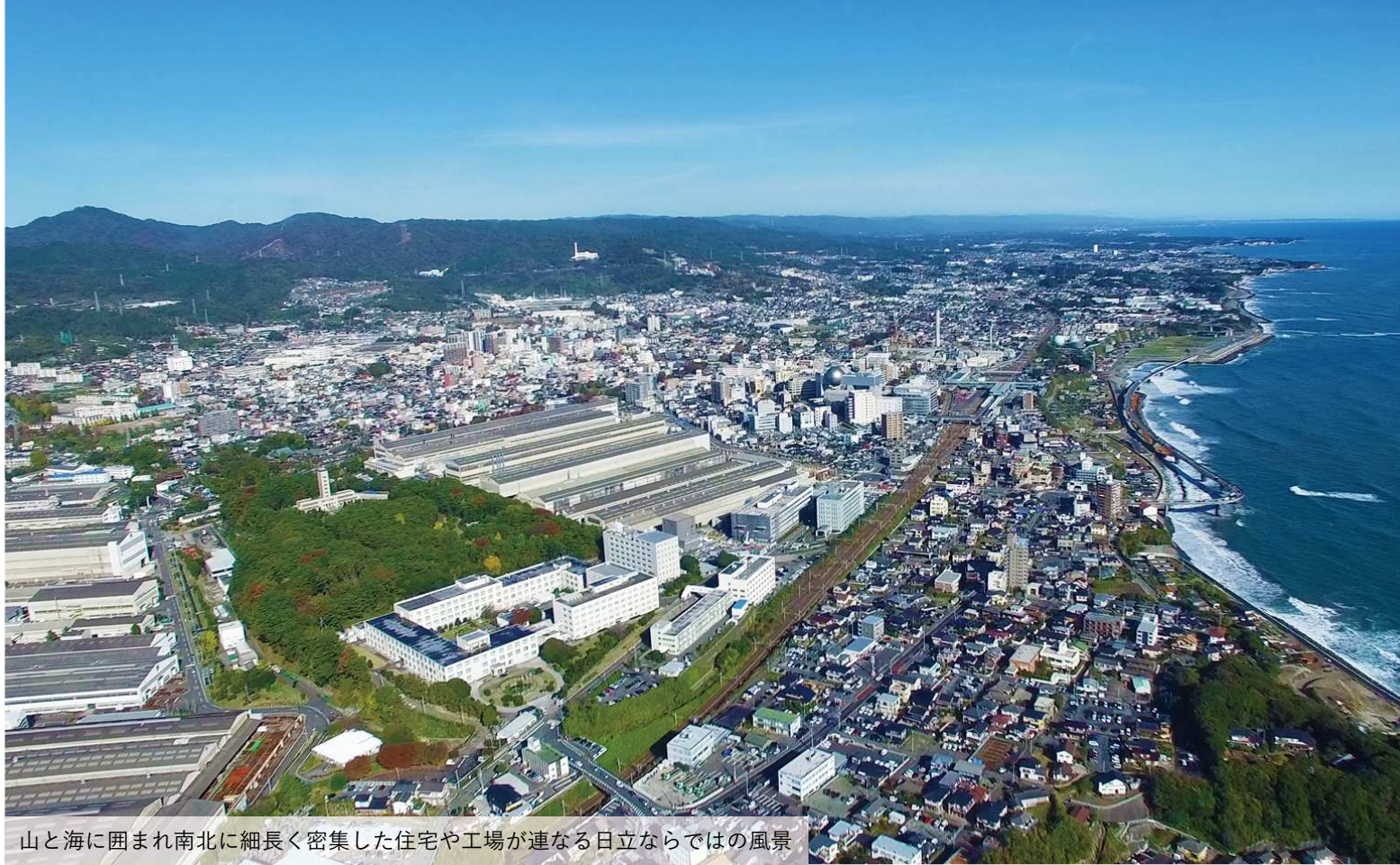
山と海に囲まれ南北に細長く密集した住宅や工場が連なる日立ならではの風景