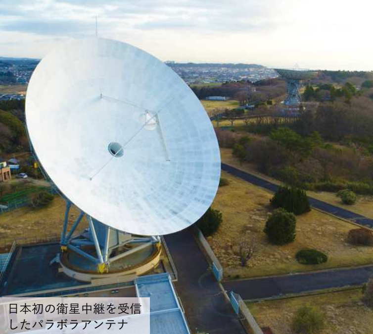
日本初の衛星中継を受信したパラボラアンテナ