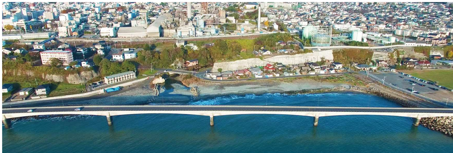
太平洋上に作られた日立シーサイドロード。車で走行すると、海の上を走っている気分を味わえる