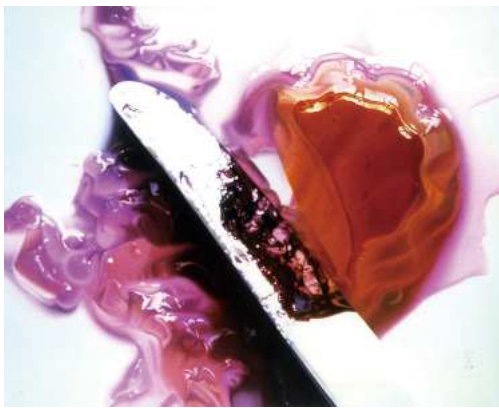
上田薫《ゼリーにナイフc》