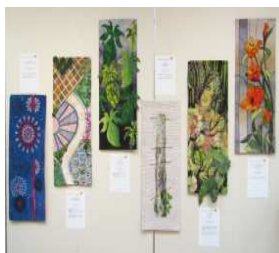
昨年度展示したタウランガ市からの作品

電話番号を電話かFAX、Eメールで、フレンドシップ・キルト展実行委員会事務局(文化・国際課 内線534 FAX 24-5301 Eメール kokubun@city.hitachi.jp)へ *申し込み後、出品要項と出品票を送付します。