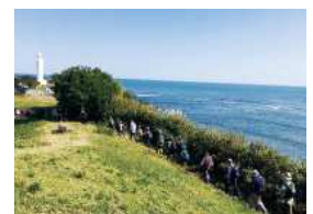
小学生歩こう会 (古房地公園付近)

インターネットやSNSの利用などについて、家庭のルールが必要なことを呼びかけるとともに、少年の主張・体験文の発表や青少年の善行などをたたえる「青少年健全育成のための市民の集い」を開催するほか、「ひたち郷土かるた」ゆかりの場所を回り郷土愛を育むとともに、日立市を徒歩で縦断し、目標を達成した時の喜びや感動を経験することで豊かな心を育成する「小学生歩こう会」を開催しています。