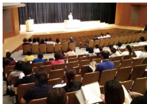
介護サービス事業者懇談会での講演会の様子