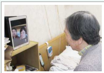
家族とのオンライン面会の様子