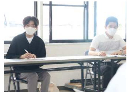
施設の取り組みや職員の想いを伺いました

学生の多くが、実習などで数日間介護施設に行き、実際に現場を経験するとイメージが変わったと話します。 それは、仕事の大変さや厳しさを知ることはもちろんですが、プロの介護職の方を目にする中で、専門性を高める必要性を痛感したり、実際に働いている方の想いや利用者との関わり方を知ることにより、介護のイメージが変わっていくのではないかと思います。 介護施設や介護職と聞くと、マイナスのイメージを抱かれることも多いですが、実際に介護施設を訪れると、職員が利用者と良好な関係を築き、利用者がその人らしく生活できるようにさまざまな面から配慮されています。 物事は、知ることによって思いが生まれます。介護施設が地域の方や介護職を目指す方にとって身近な存在となり、関わりやすい場となることで、多くの方に介護の仕事について知ってほしいと思います。このプロジェクトがその一助になることを期待します。