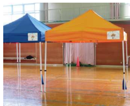
助成金で整備したテント

この宝くじの社会貢献広報事業は、(一財)自治総合センターが宝くじの受託事業収入を財源として、コミュニティ活動に直接必要な設備などの整備にかかる経費を助成しているものです。