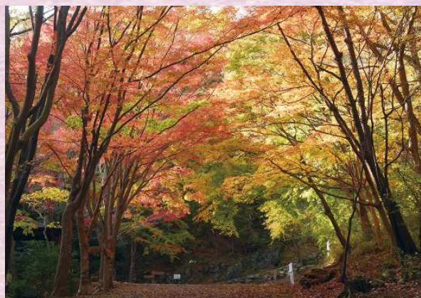
小木津山自然公園