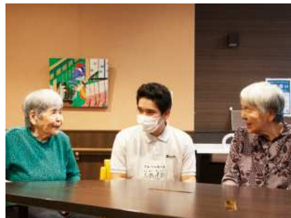
利用者さんと会話を楽しんでいる様子