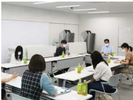
介護保険制度について勉強しました

高校三年生のとき、高齢者デイサービスのボランティアに参加したことで福祉の仕事に興味を持ちました。一方で、介護に対して、マイナスのイメージも持っており、そのイメージが変わるきっかけになるのではないかと考え今回のプロジェクトに参加しました。 今は多くの方が長生きする時代で、介護を経験する方は多いと思います。私自身が今回のプロジェクトで経験した「イメージの変化」を多くの方と共有できるように介護の魅力を伝えていきたいです。 将来は、利用者の充実した生活を支援できるような仕事をしたいと思っています。これから盲老人ホームで実習を行います。今は楽しみな気持ちと、不安な気持ちが入り混じった状態です。多くのことを学び、まずは自分も利用者も楽しい気持ちを持てるような実習にしたいと思っています。