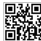
いばらきふくしのおしごとナビ QRコード

問合せ 県福祉人材センター（県社会福祉協議会内） TEL 029-244-4544