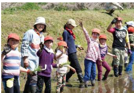
コミュニケーション科での能楽や米作り体験の様子