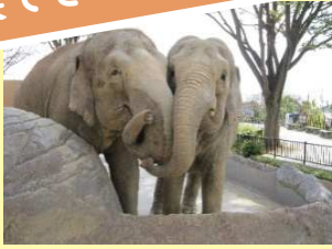
かみね動物園・レジャーランド共通入場券