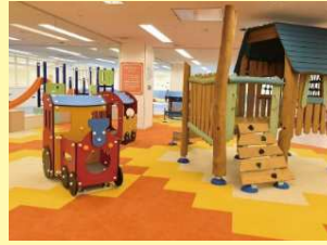
Hiタッチランド・ハレニコ！入場券