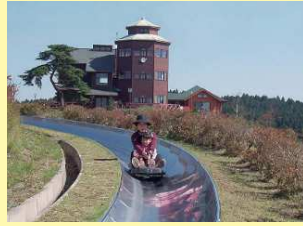
奥日立きららの里入場券