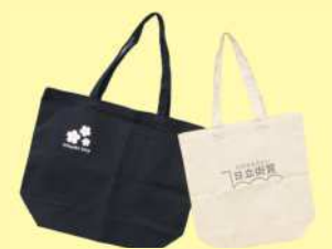
ラジオ体操エコバッグ (画像はイメージです)