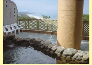
鵜来来の湯十王利用券