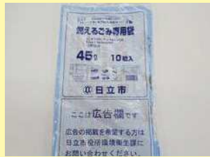
日立市指定ごみ処理袋 (45リットル・10枚または 20リットル・20枚)