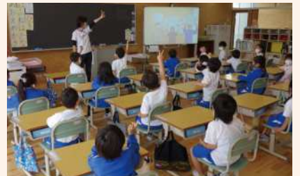
校内ライブ放送の機能で、 1年生を迎える会を行いました