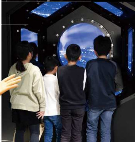
国際宇宙ステーションからのながめ