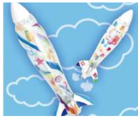
「おえかきロケット」300円