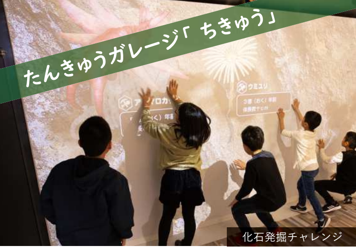
化石発掘チャレンジ

たんきゅうガレージ「ちきゅう」では、雨や虹、竜巻などの気候に関する不思議や、日立の地形の特徴などについて学ぶことができます。