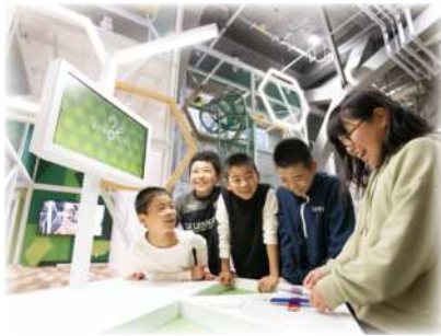
「はてなコンテナ」では楽しい実験を体験できます

と思いますが、科学館に来たことをきっかけに、科学は難しいものではなくて、身の回りにはあふれているということに気づいてもらい、興味をもってもらえると思います。楽しいと感じてもらえるような展示や実験ショーを今後も行っていきたいと思っています。夏休みに向けてイベントなども企画していますので、ぜひ遊びにきてください。