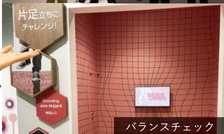
バランスチェック