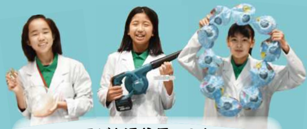
子ども通信員の3人