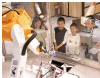
ロボット画伯アートン