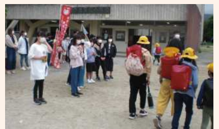
いいところ"2つ目" マナーアップの様子