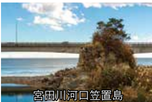
宮田川河口笠置島

日立市役所臨時駐車場集合 (9:00)→宮田川河口笠置島・ JR常磐線メガネ橋→八幡清水 跡→沼川弁財天→助川交流セ ンター解散(13:00)【約5.2km】