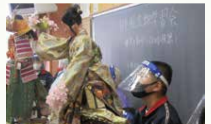
日立風流物の 人形操作体験の様子