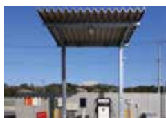
自家用給油取扱所