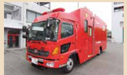
津波・大規模風水害対策車

傷病者を医療施設などに搬送するための車両。適切な処置を行い迅速・安全に搬送する。