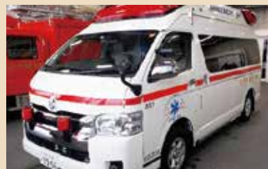
高規格救急自動車

傷病者を医療施設などに搬送するための車両。適切な処置を行い迅速・安全に搬送する。