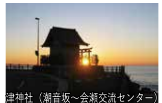
津神社(潮音坂~会瀬交流センター)

会瀬交流センター集合(8:50) →会瀬十字→会瀬洞門→寺 の坂→経塚→正門橋→トン ネル(引込み線)→潮音坂→防 空壕跡→会瀬交流センター解 散(12:00)【約4.0km】