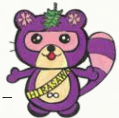
平沢中学校の スクールキャラクター 「ひらポン」