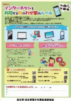
「家庭のルール」を設けるチラシ

インターネットを利用する年齢は年々低年齢化しているため、インターネットに触れ始めるとされる小学1年生とその家庭を対象に「家庭のルール」を設けるチラシ約1,500枚を配布しました。