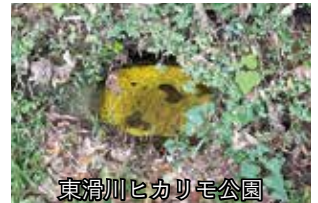
東滑川ヒカリモ公園

田尻交流センター集合(9:00)→ 度志観音堂跡→太田尻海岸→製 塩岩穴→ソバナゴ海岸→東滑 川ヒカリモ公園(昼食)→シー マークスクエア屋上公園(足 湯)→田尻交流センター解 散(14:30)【約9.0km】