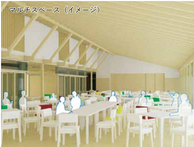
マルチスペース（イメージ）

明るく開放的なスペースで、みんなで楽しく給食を食べたり、発表会の開催など、さまざまな活動を展開できます。