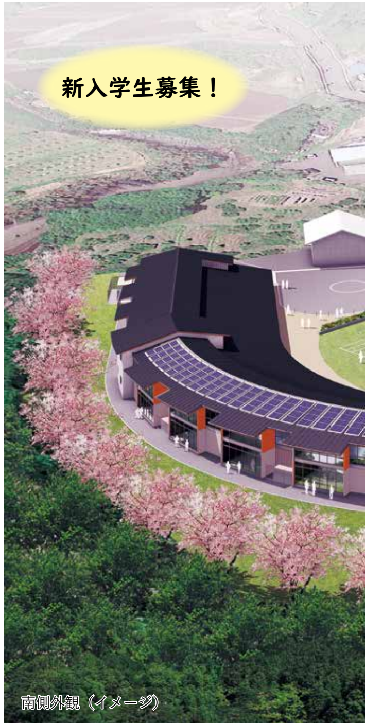
南側外観（イメージ）