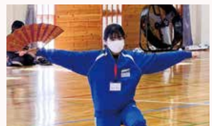
能楽の発表に向けた練習の様子