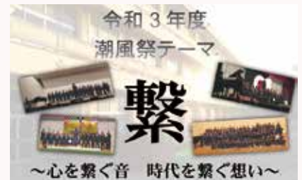
「つながり」を大切にした 潮風祭のテーマ