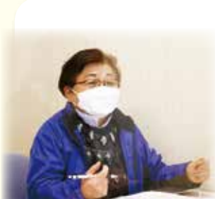
子どもセンター支援相談員