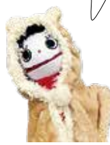
パンパカもこちゃん