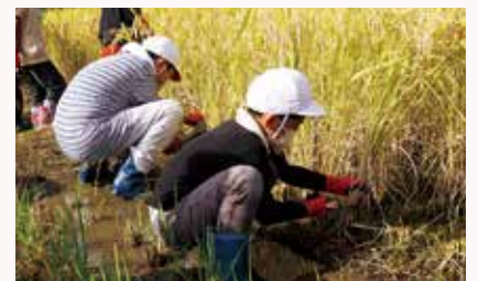
全校児童で稲刈り