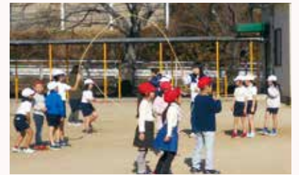
みんなで遊ぶ休み時間