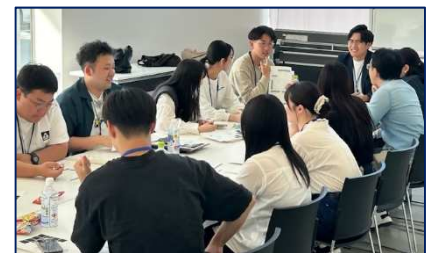
○若者の場づくり及び拠点施設の検討 ひたち若者ががやき会議で継続実施