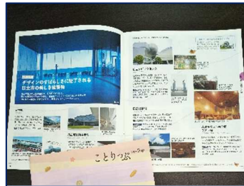
○日立市の魅力発信 女性向け観光情報誌でPR。