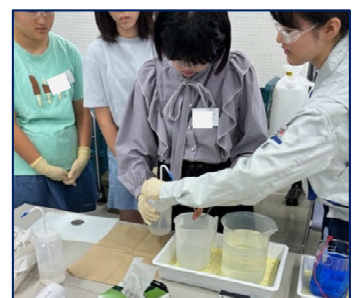
○日立版リコチャレロールモデル講座(中学生)