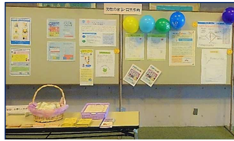
○啓発パネルの作成・展示 男性の家事育児参画や仕事と家庭の両立を啓発するパネルを作成し展示。