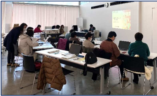
○日立市各種女性団体連絡会研修会（参加者 17人） 「日々の暮らしを豊かにするデジタル講座 -生成AIを使ってみよう-」