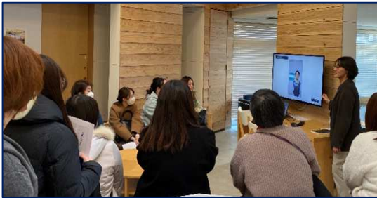
○女性デジタル人材育成講座(全4日)（参加者 延べ66人） プログラミング学習と企業見学会により就業促進を図った。