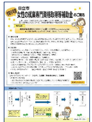
○女性の就業専門資格取得等補助金