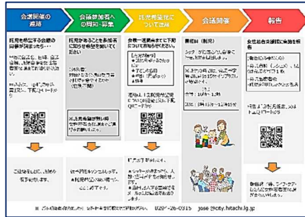
○子育て世代の審議会参画促進の取組 子育て世代の方にも政策決定の場に参画していただけるよう、託児サービスの導入支援を実施。