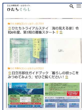
○移住コンシェルジュによる情報発信 市の魅力を親しみやすく発信。UIJターンの促進につなげた。(市HPより)