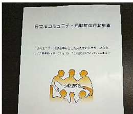
○コミュニティプラン改訂支援 多様で魅力ある地域活動に向け、プランの見直しを進めた。