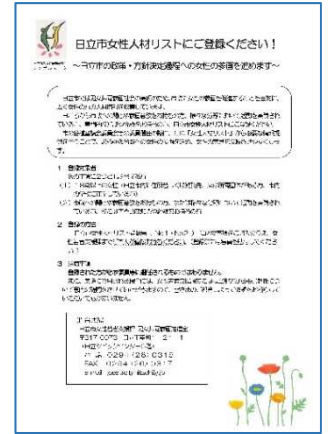
○女性人材リスト活用事業 市政に関心のある女性を対象に人材リストを作成し、審議会委員への推薦により参画を支援。