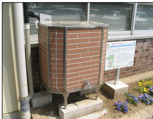
雨水貯留槽の例（日立市役所本庁舎設置状況）

屋根に降った雨水を、雨どいを通して引き入れ、一時的に溜めることができる水槽です。溜めた雨水は、庭木の水まきや洗車のほか、地震や火災などの緊急時の用水として利用することができます。