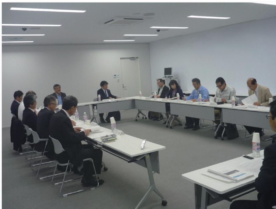
日立市上下水道事業経営戦略策定有識者会議