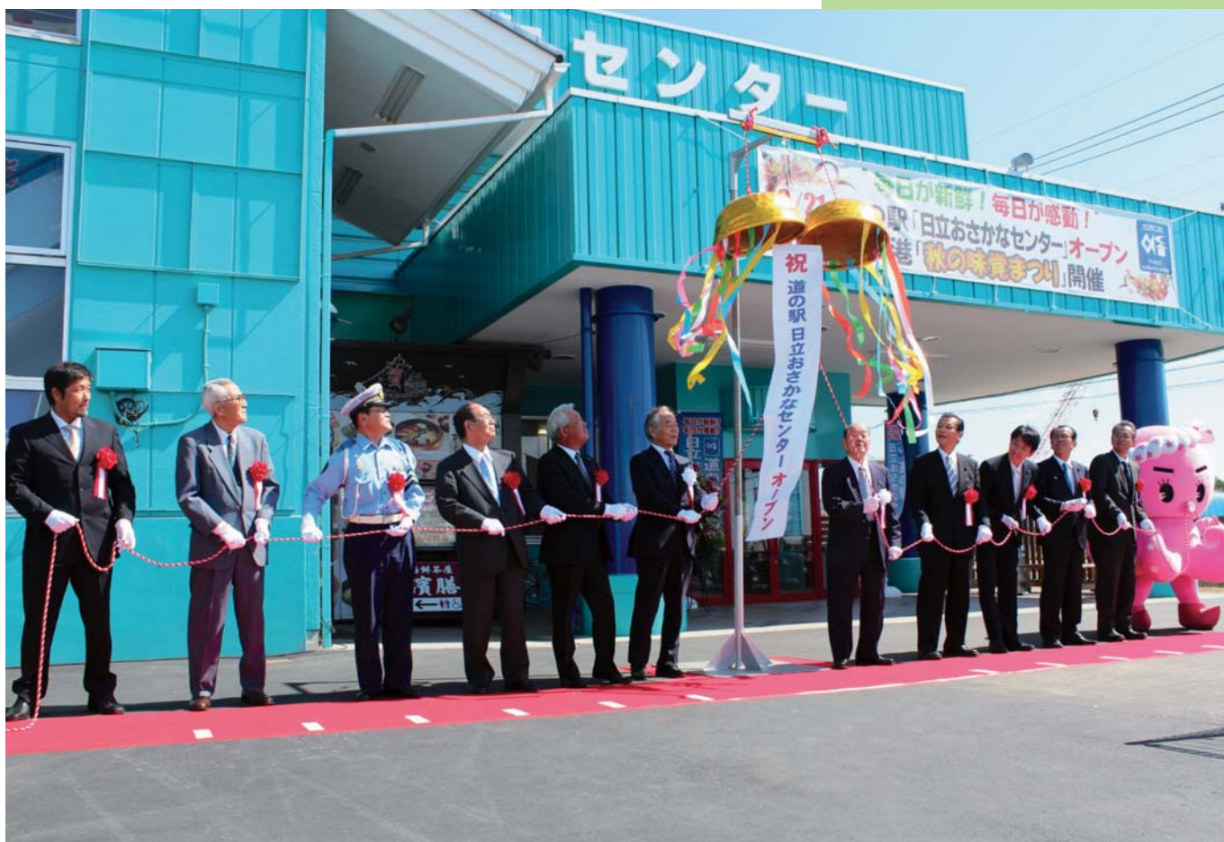
9月21日に行われた道の駅「日立おさかなセンター」オープン記念式典