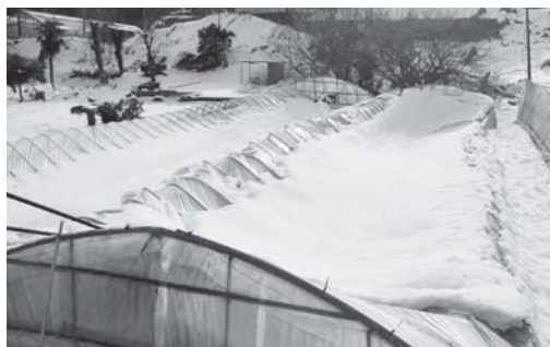
2月の大雪により、被害を受けたパイプハウス(小木津町)