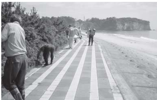
地域コミュニティによる海岸清掃活動(川尻町)

議員 市職員の積極的な地域活動への参加を促しているようだが、効果は十分ではない。今後の対策を伺いたい。