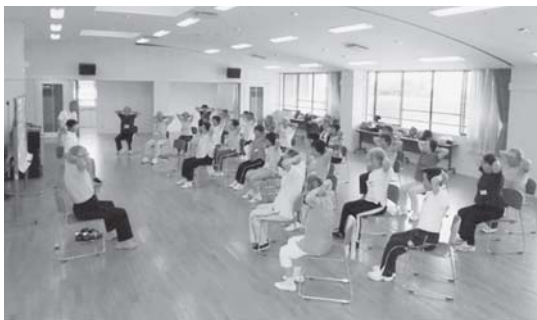
各地域で行われているシルバーリハビリ体操

また、日立市シルバーリハビリ体操指導士会独自の活動として、シルバーリハビリ体操教室を市内約80箇所で開催している。平成25年度は1,085回、延べ2万1,224人に介護予防体操を普及し、高齢者の運動機能の維持向上に尽力いただいた。