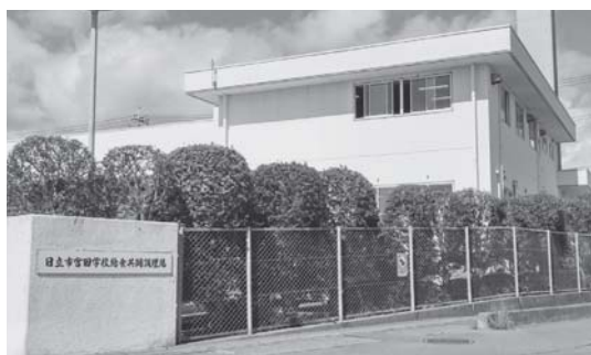
建設から30年以上が経過した宮田学校給食共同調理場

十王調理場や南高野調理場と同じ最新の食缶等の規格に合わせるためには、大規模な設備改修が必要となるため、当面、現在の設備でもできる短期的な対応策を検討していきたい。