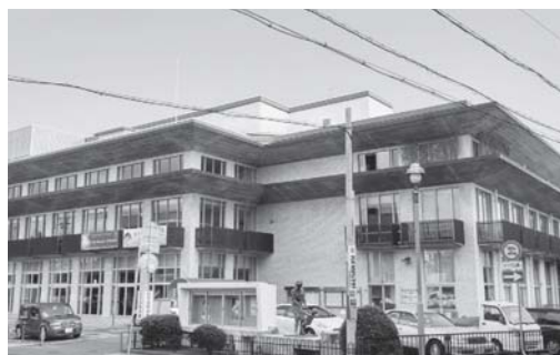
震災で被災し再開した日立市民会館(若葉町)

○不納欠損額の削減 ○未来都市モデルプロジェクト推進事業の見える化 ○日立市民会館の利便性向上 ○中小企業者への支援の推進 ○上下水道事業の経営効率化 ○耐震化が完了した学校の未改修部分の整備