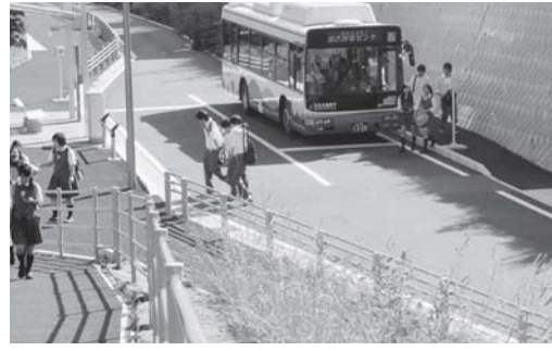
大甕駅～日立おさかなセンター間で運行しているひたちBRT