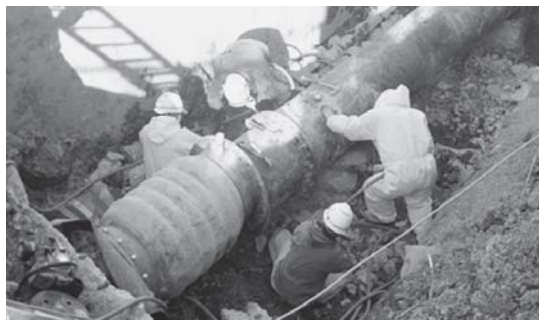
東日本大震災により被災した下水道圧送管（滑川町）

上下水道部長 下水道施設の老朽化による維持管理コストの増大や下水道管の更新、東日本大震災を教訓とした耐震化の推進、人口減少等を踏まえた効率的な整備など、様々な課題への対応が求められている。 引き続き、健全な下水道事業の経営と安定したサービスを提供するとともに、これまでの対症療法型から予防保全