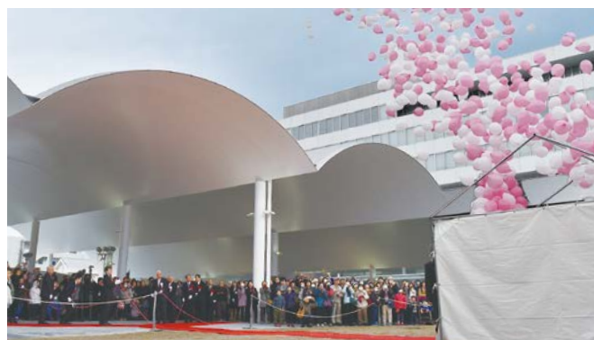
多くの市民の皆さんとともに、グランドオープンを祝してバルーンリリースが行われました