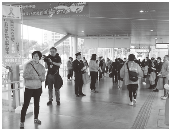
日立駅で実施された児童虐待防止の街頭啓発活動

また、平成29年4月には、子育て世代包括支援センター「すこやかひたち」を開設し、関係課所が連携して妊娠から子育ての様々な相談、支援に対応している。引き続き、それらの体制強化を図りながら、虐待予防と虐待が疑われる家庭への切れ目ない支援に取り組んでいく。