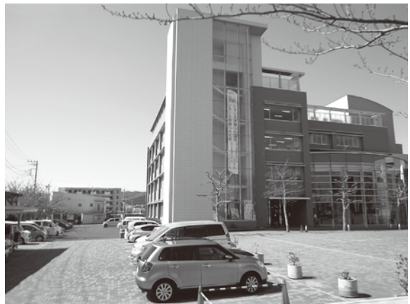
1日平均約400台の利用がある多賀市民プラザ駐車場