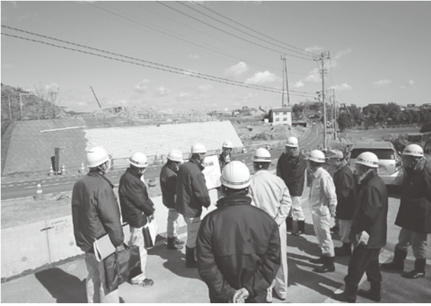
公設市場東側の市道3号線改良工事の現地調査を実施

の改良工事に係る経費、空き家のリフォーム・解体や、子育て世帯等の山側住宅団地への住み替えに対する補助金の計上など》 〔要望〕 ○定住や住み替え促進に向けた各種施策については、将来のまちの姿を見据えながら積極的な情報提供や事業手法を検討し、有機的に連携させながら力強く推進されたい。 ▼平成31年度水道事業会計予算 《森山浄水場と大沼配水場を結ぶ第7送水管の更新工事や、市内の配水管更新工事に係る経費の計上など》 ▼日立シビックセンター科学館整備基金の設置及び管理に関する条例の制定 《国の交付金を受けて科学館を整備するために、新たに基金を設置する》