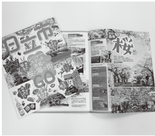
「るるぶ」を見た多くの方の来訪が期待される

「そこ吹く風、ひたち風」のマークについては、マークを印刷したポールペンやうちわを配布したほか、職員用名刺などで活用を図っている。引き続きピンバッジやシールの作成、ホームページへの掲載などを含め、本市のイメージをアピールするため活用していく。