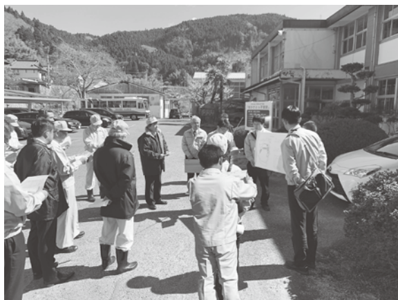
改築に向けた設計業務が始まる中里中学校の現地調査を実施

《医療福祉費(マル福)の支給対象に精神障害者保健福祉手帳1級の交付を受けた者を追加する》