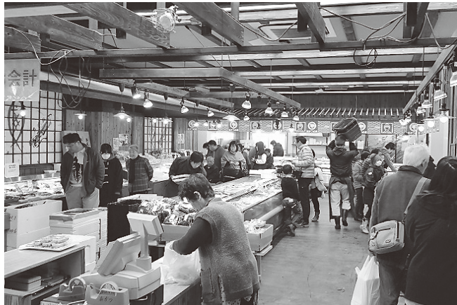
地元で水揚げされた日立の旬を販売する日立おさかなセンター

の出店者の店舗拡張や空き区画への新たな出店者の誘致を促進するため、改装や備品購入等に要する費用の一部を補助するものであり、空き区画の解消と施設内のにぎわい創出、魚介類を中心とした物産販売機能の充実により、情報発信機能等整備と併せて、おさかなセンターの活性化が期待できると考えている。