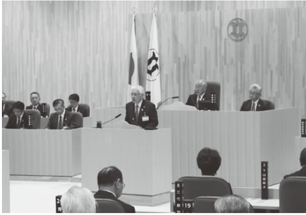
提出議案の説明を行う小川市長