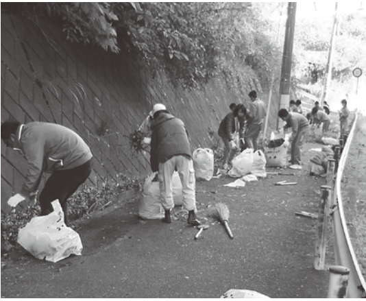
地域の方と中学生が協力して行う清掃活動

ている実態があるが、地域活動は「共助」といわれる相互扶助の精神が根底にあり、ボランティアによる自主的、主体的な取組が尊重されるべきであると考えます。