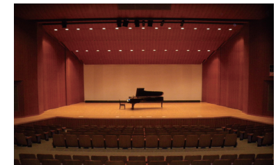
多目的ホール（通称：Jホール）

◆十王総合健康福祉センター（通称：ゆうゆう十王）は、市民の健康づくりの場および市民の福祉・文化活動の場として親しまれている総合施設です。多目的ホール・研修室・調理実習室などの貸出し（有料）も行っています。ご利用の際は事前の申請が必要です。詳細はお問い合わせください。（☎ 39-7111）